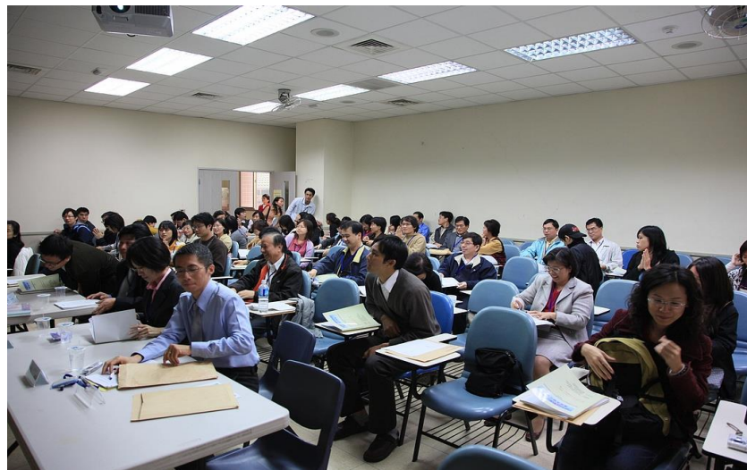
統計學術研討會會場紀實

統計學術研討會由本社及政治大學統計學系等共同籌劃，接續於當日上午 10 時 30 分開場，計有 24 個場次，分 3 個時段進行研討。會中總計發表 101 篇論文，其中政府統計論文 17 篇，學術論文 84 篇。