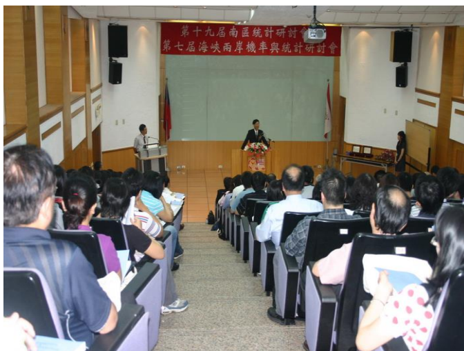
第十九屆南區統計研討會暨第七屆海峽兩岸機率與統計研討會開幕式

府城之於台灣，就像京都之於日本。這次在成大舉辦南區統計研討會，俯拾皆是的歷史古跡與美食小吃應能滿足各位好友對學術以外的匱乏感。當然，學術上的交流還是最重要的，今年會議共約 200 篇論文發表。台灣邀請的演講者約 80 人、投稿演講者約 110 人，加上大陸專家學者部分，演講場次多達 60 場，參與人數高達 530 人。此次規模盛大空前，以這樣的論文數量及與會人數，稱南區統計研討會為東南亞最大的統計盛會也不為過，相信在不久的將來，南區統計研討會能從量變到質變，成為國際上重要的統計研討會。